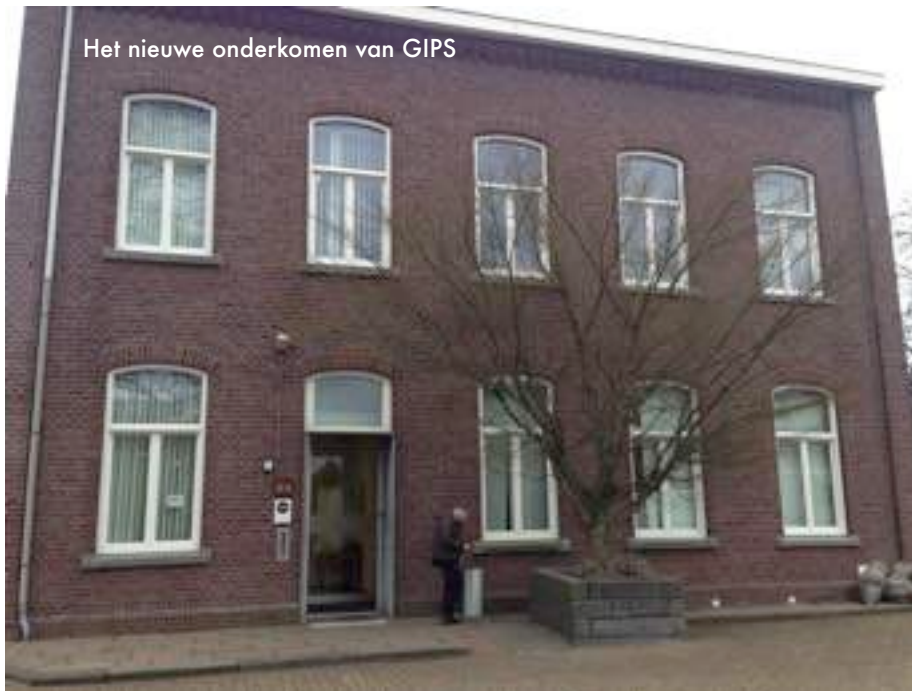
Het nieuwe onderkomen van GIPS